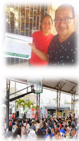
SUPER BINGO ESCOLAR